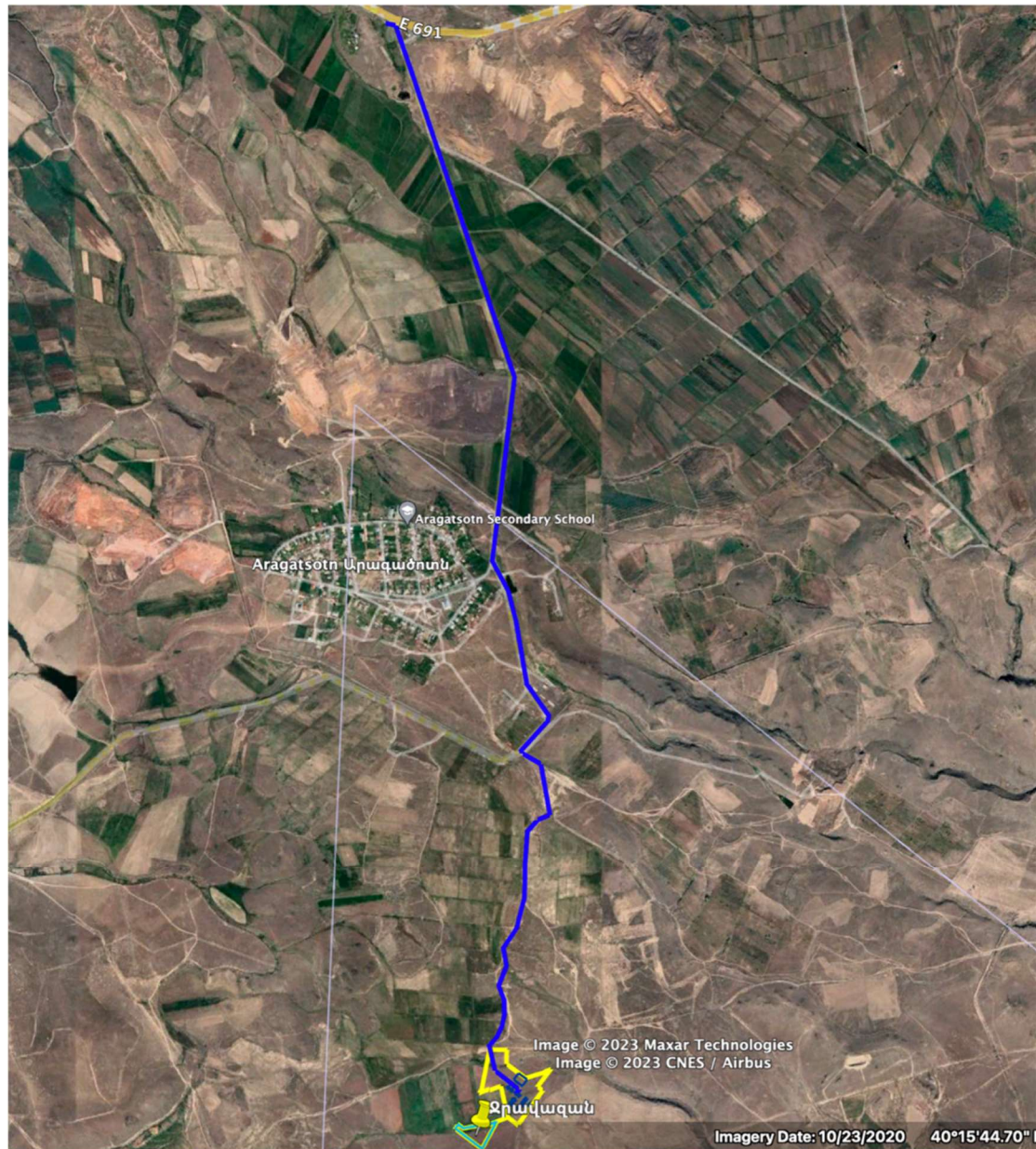
Քարտեզ 1. Խմելու ջուր